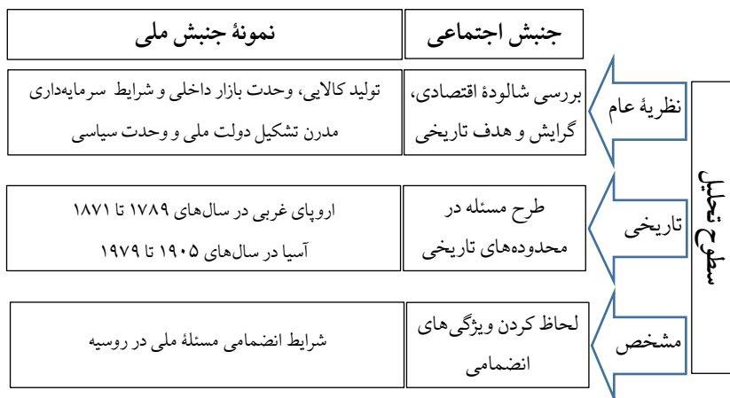
شکل (۱) شمایی از بررسی علمی یک جنبش اجتماعی

اکنون می‌توانیم در قامت جمع‌بندی طرح‌واره‌ای از بررسی علمی یک جنبش اجتماعی در سطوح تحلیلی مختلف را در شکل زیر نمایش دهیم.